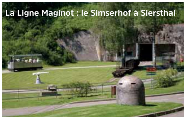
La Ligne Maginot : le Simserhof à Siersthal