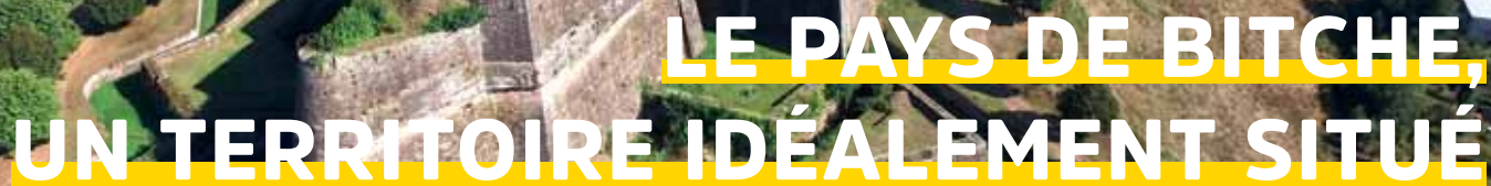
Citadelle de Bitche