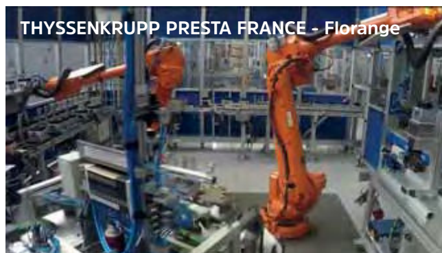
THYSSENKRUPP PRESTA FRANCE - Florange