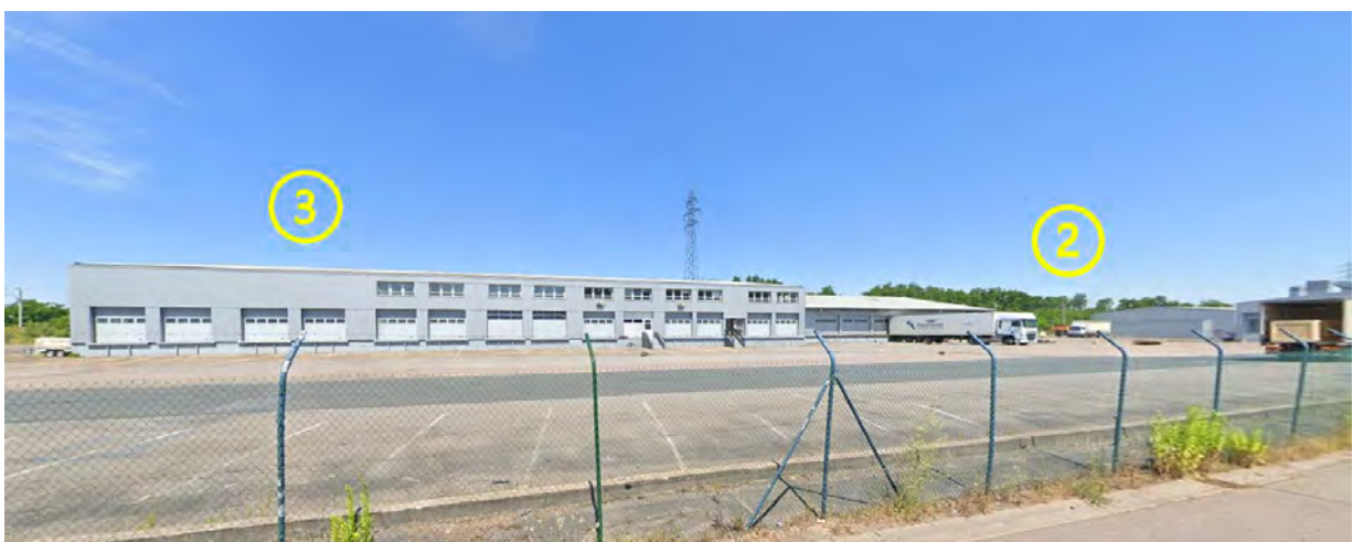
Figure 8 : Lots 2 et 3 / Espaces extérieurs avant (Dépôts avec portes sectionnelles + bureaux à l'étage)