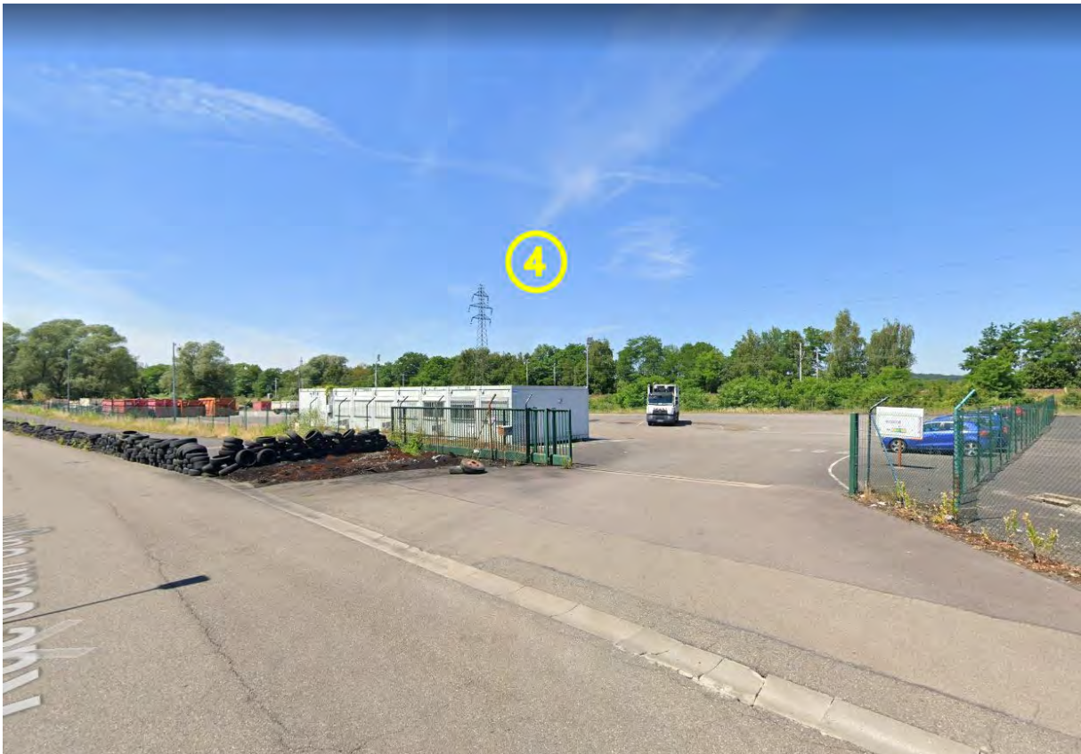
Figure 10 : Lot 4 / Espaces extérieurs (Avant modification clôture)