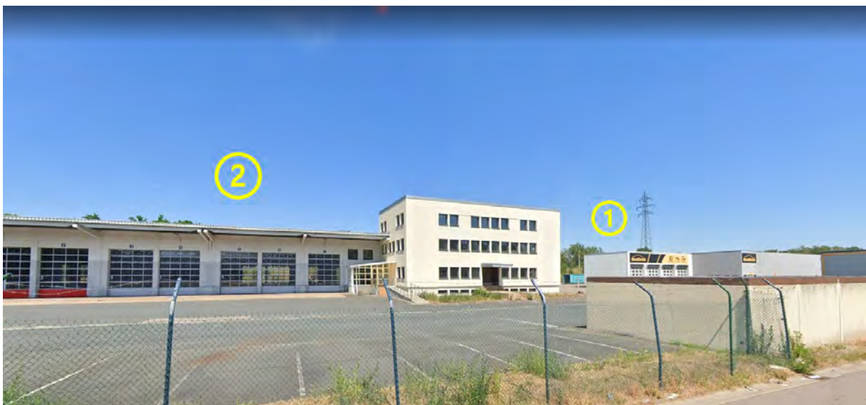
Figure 4: Lots 1 et 2 / Espaces extérieurs avant (Bâtiment administratif modifiable f + dépôts avec portes sectionnelles)