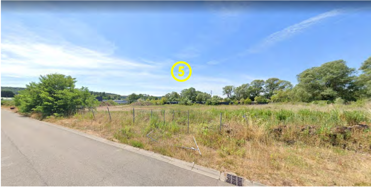
Figure 11 : Lot 5 / Espaces extérieurs (Terrain constructible de 8 323 m 2 )