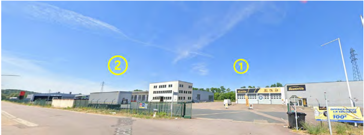
Figure 3: Lots 1 et 2 / Espaces extérieurs avant (Espace stockage macadamisé clôt + accès site avec portail)