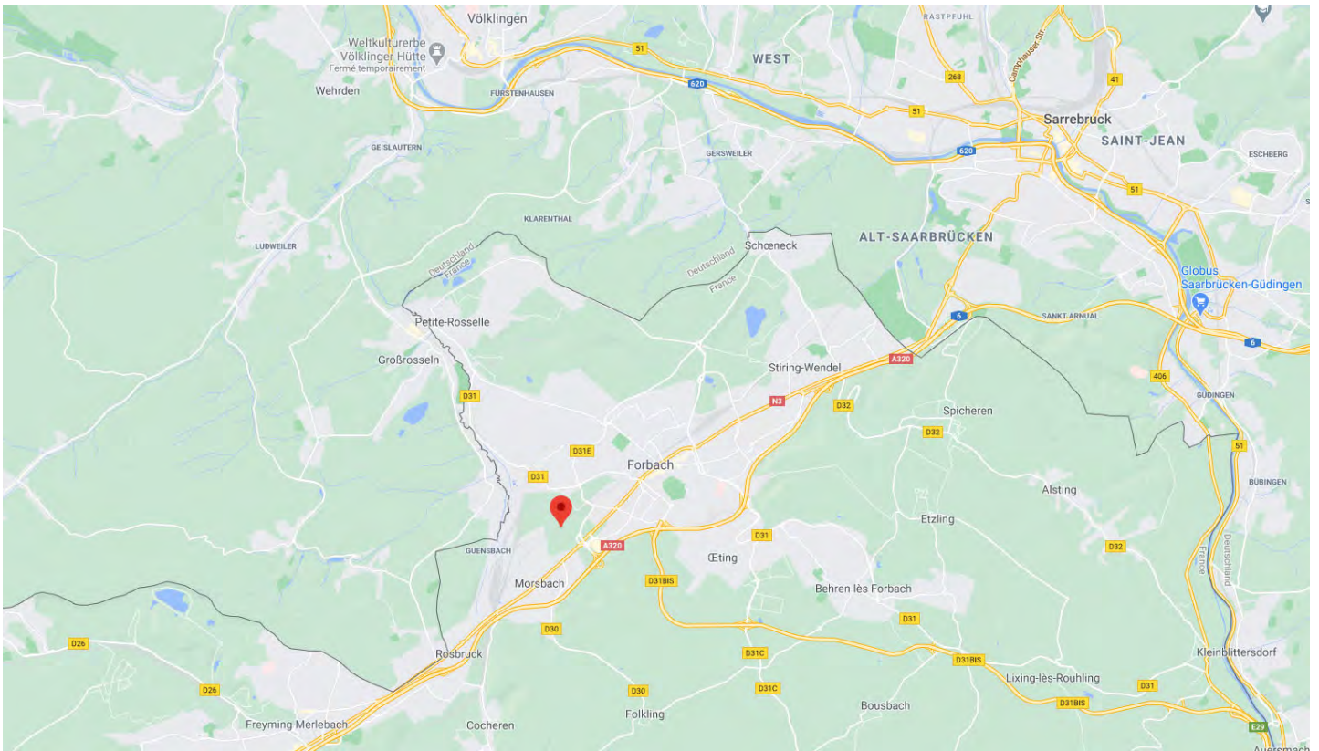
Figure 2: Vue Satellite (Proximité ville de FORBACH et SARREBRUCK)