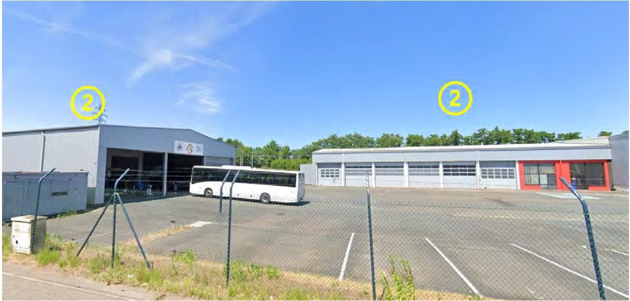
Figure 6: Lot 2 / Espaces extérieurs avant (Dépôts avec portes sectionnelles et carrosserie avec bureaux bungalow)