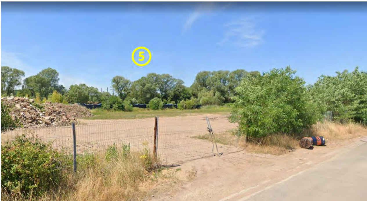
Figure 12: Lot 5 / Espaces extérieurs (Terrain constructible de 8 323 m 2 )