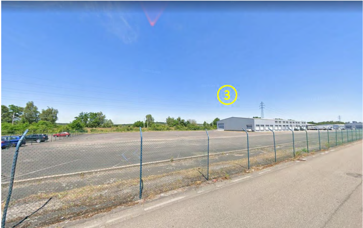
Figure 9 : Lots 3 et 4 / Espaces extérieurs avant (Stockage macadamisé de plus de 30 000 m 2 )