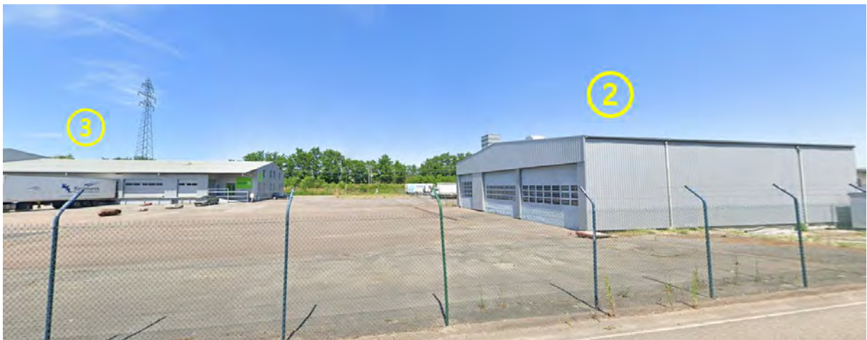
Figure 7: Lots 2 et 3 / Espaces extérieurs avant (Carrosserie avec 6 portes sectionnelles traversantes)