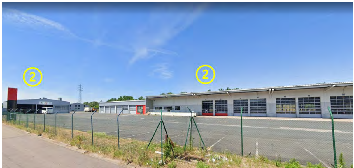
Figure 5: Lot 2 / Espaces extérieurs avant (Dépôts avec portes sectionnelles et carrosserie indépendante)